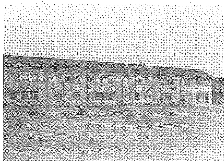
昭和34年頃のオンボロ校舎

或る企業から“水の科学”というテーマで講演依頼があった。改めて最近の水に関する資料をいくつか取り寄せてみると、予想以上に我が国の源水の汚染状態は酷く、よって浄水場での塩素の投入量は増加するいっぽうで、毎日水道水を口にする消費者は自衛手段として、高価なミネラルウォーターを購入しているようだ。テレビジョンでは、連日山奥の清流を映し、あたかもその場で採水してボトルに詰めて販売しているかのイメージ広告で、販売量の増加を図っているが、実際は国道沿いの井戸水を汲み上げ過熱殺菌して販売をし